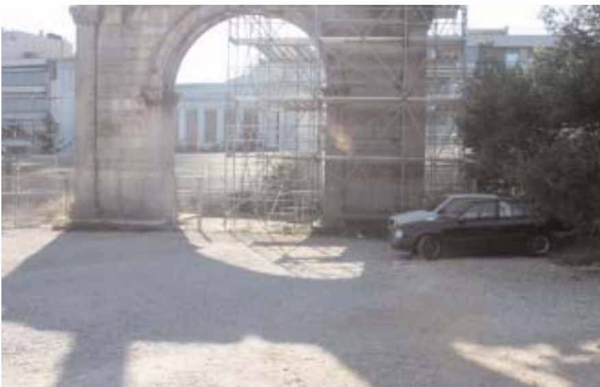
The usual parking place of the employess (ministry of culture) of the Dion