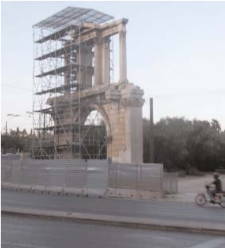
The tram tries to pass 1 meter only away