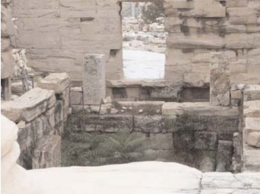
Erehteion Lake of Posidon (Erehteian sea) a marble floor with some salty water destroyed now and a hole now were the giant marble with the spring was

Μέσα στο Ερέχθειο απουσιάζει η αναφερόμενη από τον Πausανία πλάκα που ανέβλυζε υφάλμυρο νερό και για την οποία αναφερόταν ο γνωστός μύθος της διαμάχης της Αθηνάς και του Ποσειδώνα. Αυτή η μαρμάρινη πλάκα μέχρι προ διετίας υπήρχε. Σε ερωτήσεις για την καταστροφή, οι απαντήσεις κάποιου ήταν “δεν ήταν καλό ήταν αλμυρό”, και από τον κο Ζάμπα μηχανικό στην αναστήλωση, ότι “μαζευόταν από την βροχή”. Η ύπαρξη του νερού και στους καλοκαιρινούς μήνες δείχνει την άγνοια και των ανθρώπων που ασχολούνται με αυτά τα ευαίσθητα θέματα.